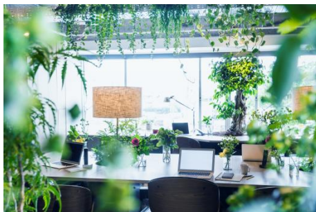
COMORE BIZ イメージ