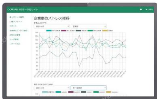
管理者向けストレスレポート

また、最先端のITを駆使し、従業員のバイタルセンシング（生体情報の取得）による効果測定を行うことができます。