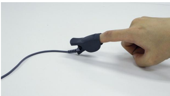
ウェアラブル端末 イメージ